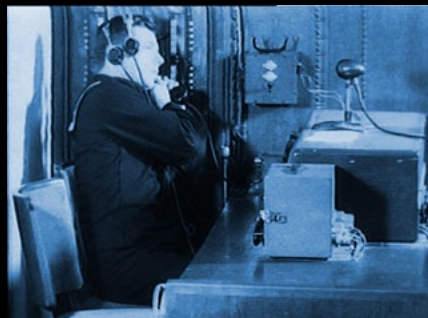
Technicien assis à côté des installations